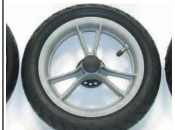
synthetische velg + luchtband