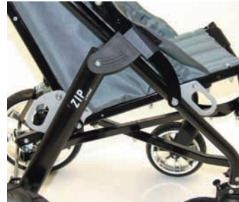
Transportbeveiliging ISO 7176-19