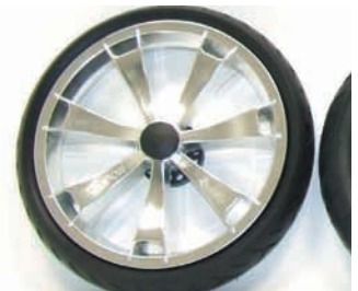
velg imitatie alu + polyurethaanband