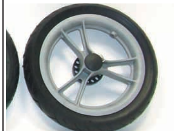
synthetische velg + polyurethaanband