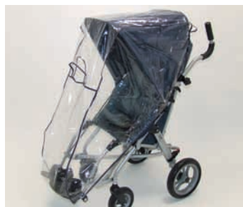
Kap + doorzichtige hoes