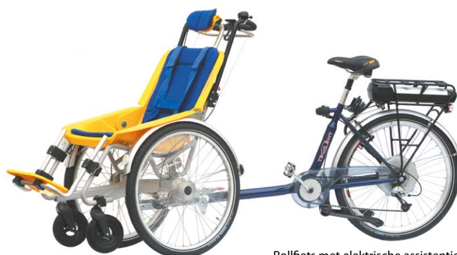
Rollfiets met elektrische assistentie