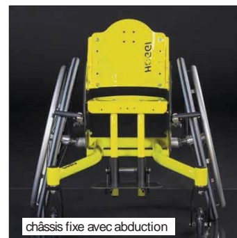
châssis fixe avec abduction