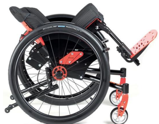
bascule d'assise (option)