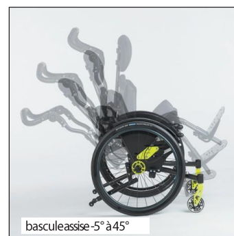
bascule assise -5° à 45°